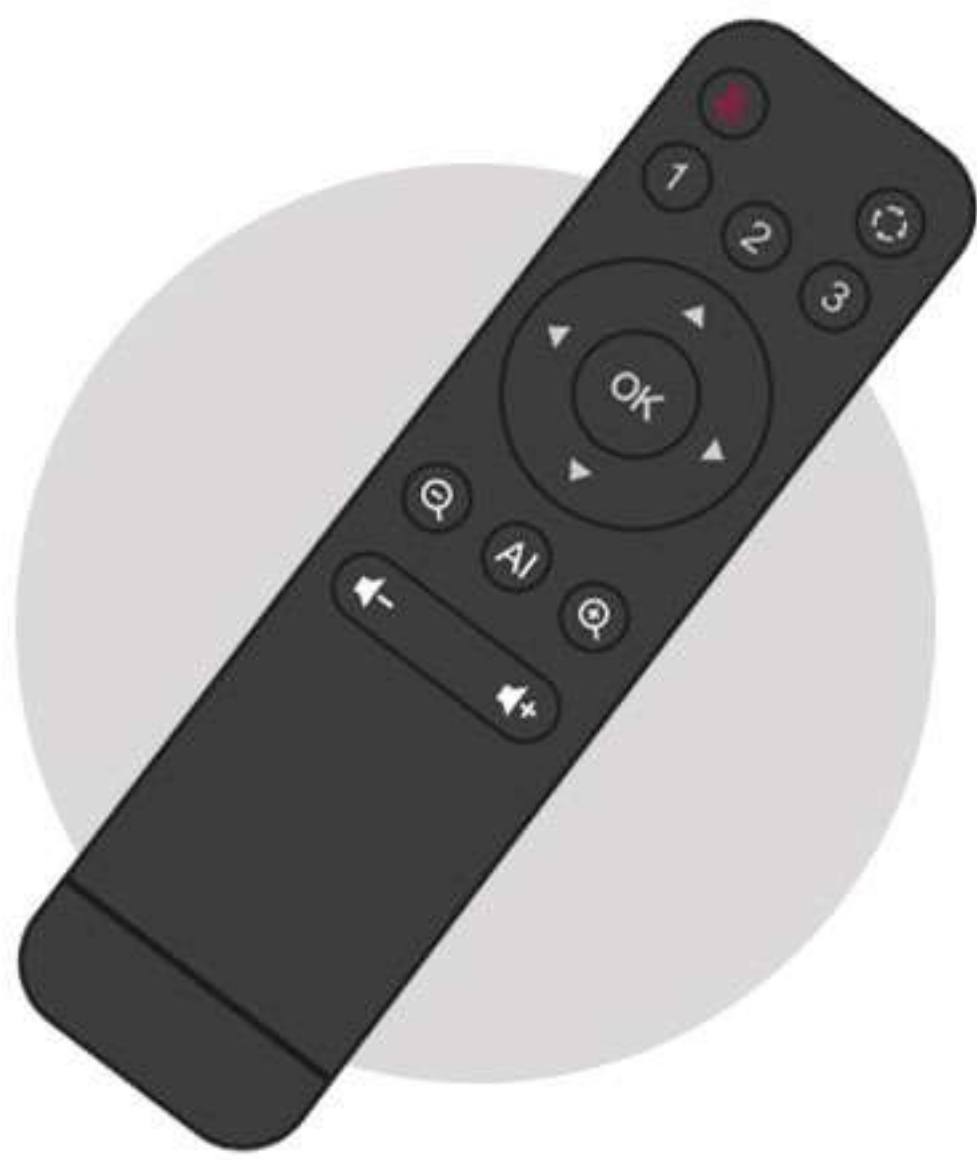
دارای ریموت کنترل

SW40 از 2 میکروفون داخلی بسیار حساس برای دریافت صدای 360 درجه برخوردار است که میتواند صدا را تا شعاع 7 متر به صورت واضح و شفاف دریافت نماید. میکروفونهای این سیستم دارای قابلیت Noise Reduction و Eco Cancellation می باشد که موجب میشود نویز های محیط و پژواک صدا کاملا محو شده تا کاربران بتوانند از یک گفتگوی باکیفیت بالا بهره گیرند. همچنین SW40 از بلندگوی داخلی نیز بهره مند است. این بلندگو دارای تکنولوژی Hi-Fi است که موجب کاهش اعوجاج صدا می شود و باس بیشتری ایجاد میکند که به ما احساس واقعی بودن می دهد. این سیستم کاملا Plug-and-Play بوده و کفیست USB آن را به لپ تاپ / PC خود وصل کنید تا آماده برگزاری کنفرانس ویدیویی با کیفیت شوید.